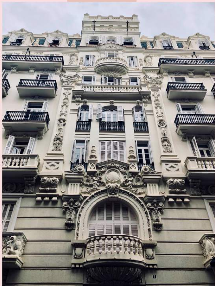
Sede central en Valencia

LULU es una firma con una imagen definida y muy reconocible que se instala desde sus inicios en 2013 como marca de referencia en el neo-romanticismo y vintage para un público de rango económico medio-alto.